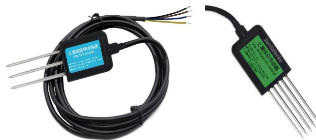
Figura 3. Sensores RS-NPK-N01-TR, RS-ECTHPH-N01-TR-1

Los sensores RS-NPK-N01-TR, RS-ECTHPH-N01-TR-1, que se presentan en la figura 3, se utilizan en AP. El primero, es adecuado para detectar el contenido de nitrógeno, fósforo y potasio en el suelo, y determinar su fertilidad. Se puede enterrar en el suelo durante mucho tiempo, por ser resistente. El segundo, es una herramienta importante en la agricultura para observar y estudiar de manera integrada nutrientes del suelo, puede medir la conductividad eléctrica, los elementos de pH, temperatura y, humedad. Se puede utilizar para mediciones estables y a largo plazo de las condiciones del suelo en un área fija a un precio económico (Renke, 2024).