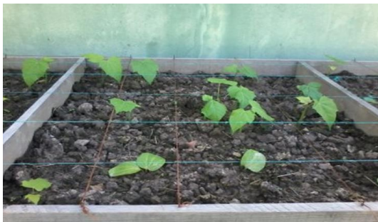
Figura 14. Plántulas en las celdas comparativas.

Al cumplir los 120 días desde la siembra, se inicia con el análisis del suelo. Por medio del equipo de retorta en el Instituto Tecnológico de Villahermosa se calculó el porcentaje de aceite y agua en una muestra de 150 g como se muestra en la Figura 14.