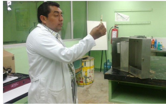
Figura 15. Tomando las muestras del equipo de retorta.

Una vez tomadas las nueve muestras de aceite se empezó a realizar conteo para determinar el porcentaje de aceite.