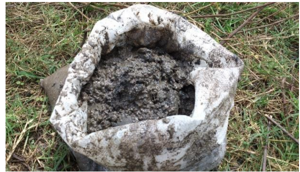
Figura 6. Recolección de tierra contaminada con Hidrocarburos.