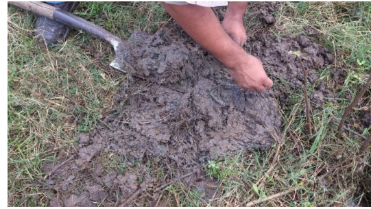
Figura 5. Extracción para la toma de muestras