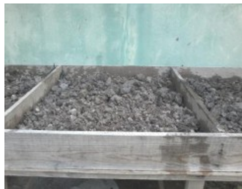
Figura 8. El suelo contaminado se coloca en las celdas de una forma homogénea.