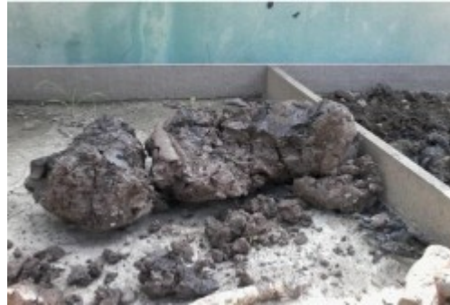
Figura 7. El suelo contaminado.

Se colocó el suelo contaminado en las celdas comparativas un aproximado de 60 kilogramos para cubrir un área de 60 x 80, y por cada celda que se menciona como celda; A, B y C. Figura 7 y 8.