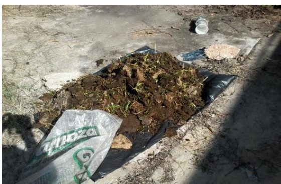
Figura 10. Preparación del estiércol de ganado bovino.

Después 24 horas de haber agregado sustrato se les agrego el estiércol de ganado bovino figura 2.17, se revolvió de forma homogénea; celda A, 5000 g, celda B 4000 g, celda C 3000 g, (Figura 10)