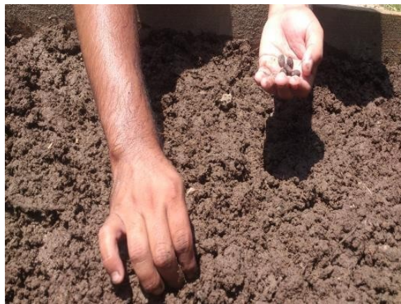
Figura. 11 semillas y Siembra de Jatropha curcas L. en las celdas comparativas.

Se prepararon las semillas de Jatropha curcas L. , para ser sembradas en las celdas comparativas en las cuales se sembraron directamente 15 semillas en cada celda. Figura 11.