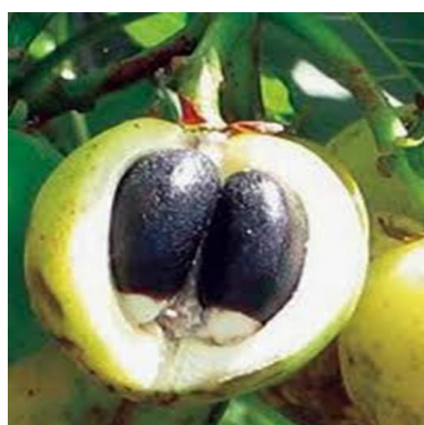
Figura 2. Semillas en crecimiento de la Jatropha curcas L.

Las semillas de Jatropha curcas L. , (Figura 2.4) de México contienen 55-60% de aceite que puede ser convertido a biodiesel por un proceso llamado transesterificación. La conveniencia de conversión del aceite de Jatropha curcas L. a biodiesel ha sido claramente demostrada por diversos investigadores. Con rendimientos del 92% de conversión.