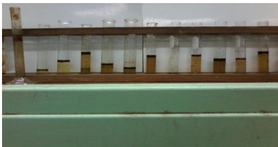
Figura 17. Las 12 muestras de la celda C.

Datos de la celda C comparativa C se pueden ver los mililitros de agua y aceite (ver Figura 17).