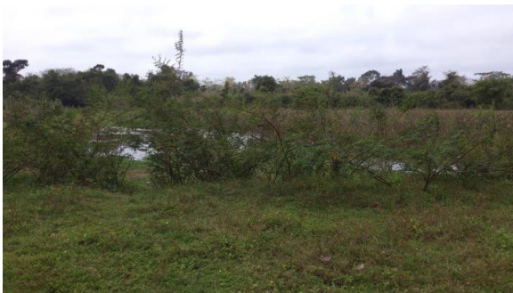
Figura 4. Terreno de la Ranchería Barranquilla del municipio del centro.

Se identificó el sitio contaminado Figura 4 a través de una visita en la ranchería Barranquilla del municipio de Centla, en el cual se pudo ver un árbol de válvulas. Figura 5 y 6, En lo que se identificó derrames en la zona a través de que en las fechas que se fue a reconocer el lugar se pudo encontrar un área de pantano y se encontró un espejo de aceite en los alrededores de la estación de válvulas de PEMEX, y se extrajeron muestras aleatorias a una profundidad de más de 15 cm.