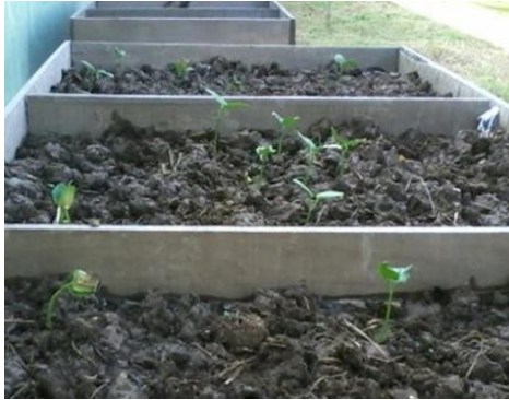
Figura 13. Respuesta de crecimiento de las semillas.

Para el crecimiento se manifestó en el crecimiento las plántulas de mayor tamaño, en respuesta de la fitorremediación en las celdas comparativas. Ffigura 13