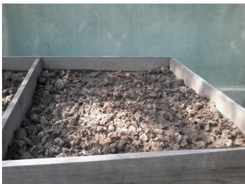
Figura.9. Agregado y mezcla de la celda comparativa.

Se trabajaron por cada celda de capacidad de un litro. En la primera celda (a) con una relación de 6000 g de suelo, 2000 g del sustrato de cal ( \text{CaCO}_3 ). Se procedió a la mezcla homogénea del mismo. En la segunda celda (b) con una relación de 6000 g de suelo, 3500 g del sustrato ( \text{CaCO}_3 ). En la celda (c) con una relación de 6000 g de suelo y 4500 g de sustratos ( \text{CaCO}_3 ) procedió a la mezcla con agua. Se dejó en reposo de 24 horas. Figuras 9.