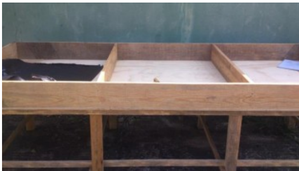
Figura 3. Celdas comparativas A, B y C

En la primera fase se construyó la celda comparativa de madera con tres celdas de mediciones de 60 cm de ancho por 28 cm de alto y 130 cm de largo, en la cual se colocó en el fondo una protección de plástico propileno oscuro en las celdas A, B y C como se muestra en la Figura 2.