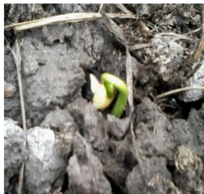
Figura 12. Brote de las semillas de Jatropha curcas L.

Se pudo empezar a notar la reacción de las semillas en el suelo contaminado empezando a brotar las plantas Figura 12.