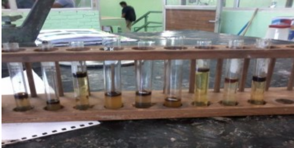
Figura 16. Las nueve muestras de la celda B.

Los cuadrantes de las celdas comparativa B, se observan los niveles de volúmenes de aceite y agua en Figura 16.