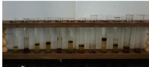
Figura 18. Las 12 muestras de la celda A.

Estos resultados fueron obtenidos de la Tabla 4, que fueron realizados por el equipo de retorta cuando el material fue extraído en las celdas comparativas que tiene un volumen de aceite en las tres celdas fue de 1.3 ml.