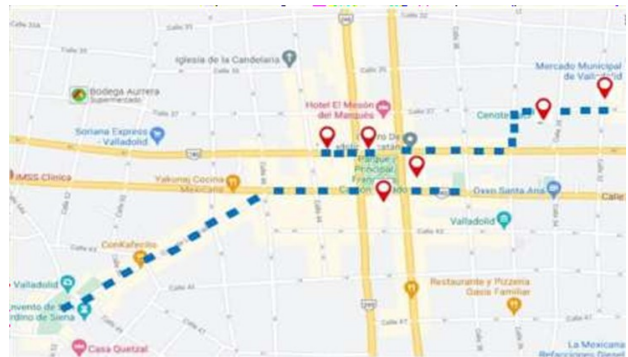
Figura 5. Rutas más visitadas en la Ciudad de Valladolid, Yucatán.

En la figura 5, se señalan las rutas más visitadas en la ciudad de Valladolid, Yucatán teniendo como origen el centro histórico, una de ellas, es la que va hacia el exconvento San Bernardino de Siena pasando por la calzada de los frailes y la otra pasa por el cenote Zaci y llega al mercado municipal de la ciudad.