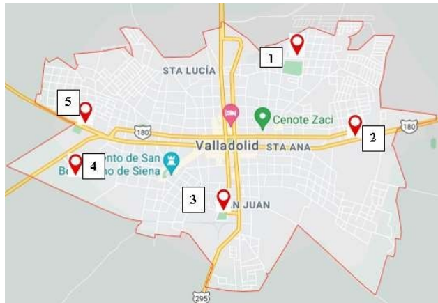
Figura 3. Mapa de la ciudad de Valladolid Yucatán, con localización de propuestas de estacionamientos internos.

En la figura 3, se pueden observar los estacionamientos dentro de la ciudad y de acuerdo con los espacios disponibles al área de lugares cercanos al centro de la ciudad.